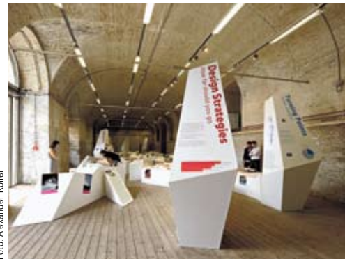
Einblick in die Wonderland-Ausstellung: Junge Architekten aus neun europäischen Ländern

Anhand von ausgewählten Architekturmodellen kann man die experimentelle und innovative Weise ablesen, mit denen sich die Büros bei Architekturwettbewerben äußern. Wonderland wurde als „botton up“-Projekt, als offenes Netzwerk für junge Architekten, entwickelt, um know-how und Informationen auszutauschen. Zwischen 2004 und 2006 wurde ein europäisches Netzwerk von 99 Teams in neun Ländern entwickelt. Siehe unter: www.wonderland.cx .