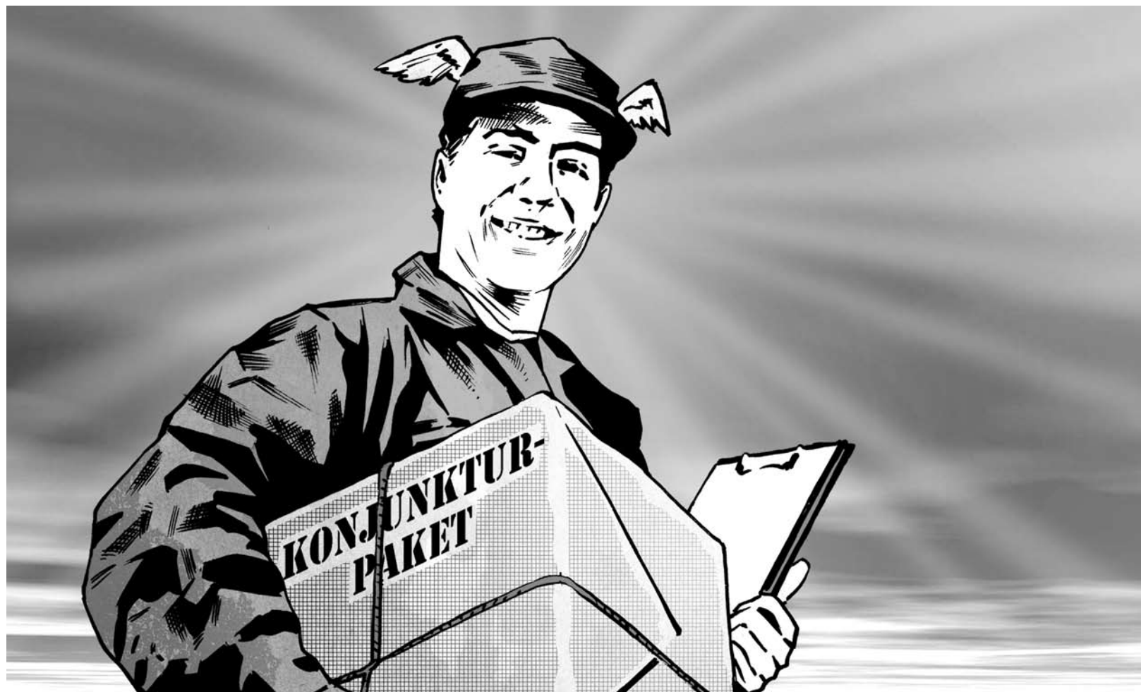
Illustration: FM Hoffmann / www.pmhoffmann.de