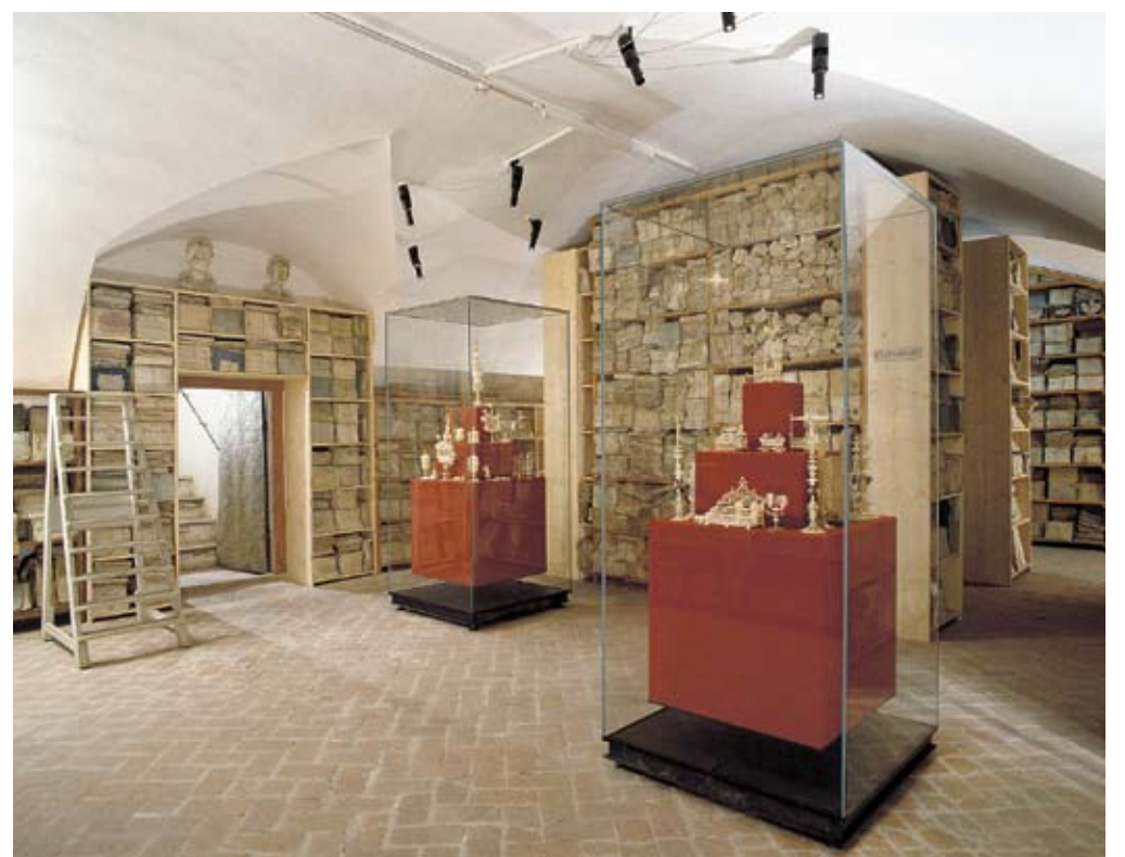
Die schwebenden Vitrinen sind zu sehen in der Schatzkammer der Fürsten Esterházy, Burg Forchtenstein

brünierter Stahl infrage. Glas steht für die Transparenz der modernen Einbauten, die sich dem historischen Ambiente unterordnen, der schwarz-braun-färbige und durch die Technik des Brünierens lebendige Stahl orientiert sich an der gewachsenen Substanz des Hauses und der häufig auftretenden Farbe der barocken Einbauten. Um die Installation des blockhaften Pyramideneinbaus in seiner Dominanz zu kontrastieren, wurden Glaskreuze untergestellt, welche die lastenden Pyramiden mit den filigranen Objekten scheinbar schweben lassen. Auch für die Bespannung bedurfte es nur eines offenen Auges für das historisch vorgegebene: Aus den ursprünglichen Barockschränken wurde eine Probe des alten tiefroten Filzes nachgewebt und aufgespannt. Auch die Proportionen der Vitrinen wurden von den Linien des Raums und seiner historischen Regalen übernommen und somit die modernen Ausstellungseinbauten ideal und harmonisch eingefügt. Der Sockel aus Edelstahl verbirgt die nötige Klimatechnik und gibt den nötigen Halt, um die Kunstwerke schwingungssicher aufzustellen. B G