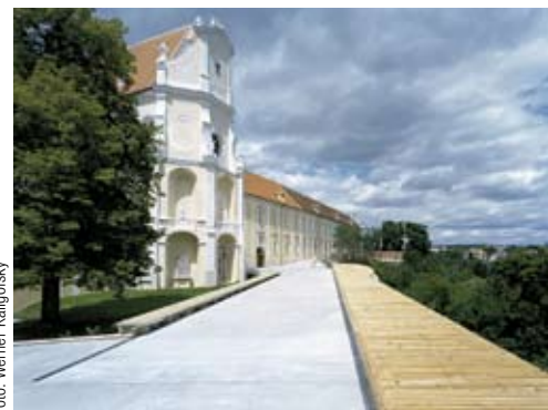
Aussichtsplattform über der überdachten und statisch sanierten Altane von Stift Altenburg

Der Sommer ist die ideale Zeit für einen Ausflug in die sensationelle Pinakothek der Moderne in München, wer ins Waldviertel fahren will, hat ein ebenso attraktives Ziel mit Stift Altenburg!