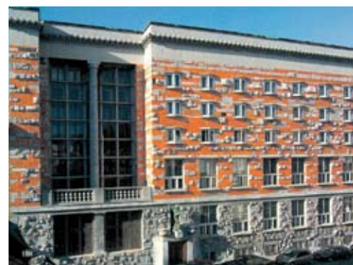
National- und Universitätsbibliothek von Jože Plečnik in Ljubljana