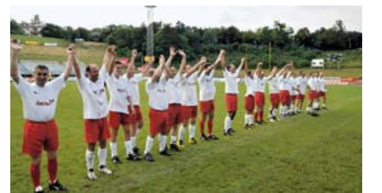
Das Erfolgsteam der Kammer will auch heuer wieder gegen das Team der Stadt Wien gewinnen