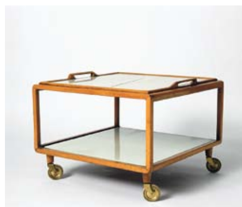
Servierwagen aus dem Wohnzimmer für Lisi Pospisil von Walter Loos, 1936