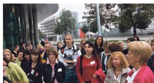
Hoch Zwei, Plus Zwei, Biz Zwei, Rund Vier und „Kipferl“. Ein Blick in das neue Viertel