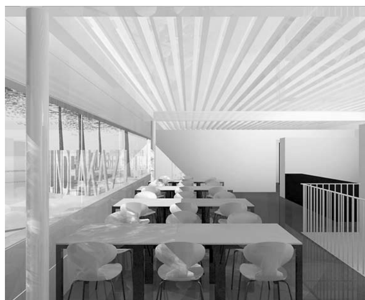
Der Wettbewerbs- und Vergabeausschuss der Kammer betreute auch den nun entschiedenen Wettbewerb für die Gärtnerunterkunft im Bereich des Rathausparks, den die kiskan kaufmann architekten gewannen.

Im Rahmen dieser sowohl praktisch als auch theoretisch orientierten Ausbildung werden die wesentlichen Elemente des Brandschutzes vermittelt und in einer Projektarbeit vertieft. ◀