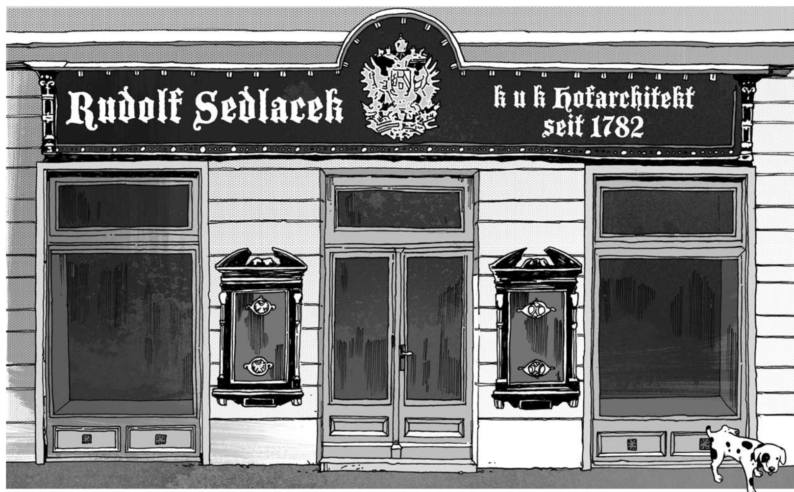
Illustration: PM Hoffmann / www.pmhoffmann.de