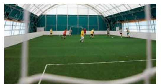
Die neue Trainingshalle des Arch+Ing-Teams bei der Alten Donau. Neue Spieler sind herzlich willkommen