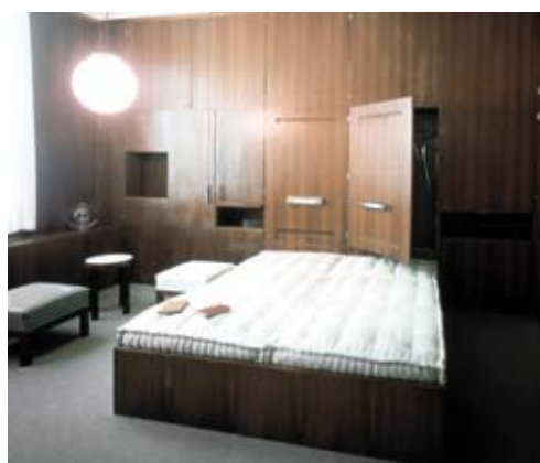
Einblick in das Schlafzimmer der Wohnung von Lucie Rie, entworfen von Ernst A. Plischke, 1928

Sonderführung für Kammermitglieder: am Mittwoch, 28. Oktober 2009, 18 Uhr Hofmobiliendepot, Andreagasse 7, 1070 Wien Ausstellungsdauer: 14.10.2009 bis 14.2.2010 Anmeldungen bei Karin Achs, Tel.: 01/505 17 81-11 oder per E-Mail: karin.achs@arching.at