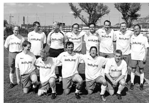
Unsere Helden bereiten sich im 14-Tages-Rhythmus auf die bevorstehenden Herausforderungen vor