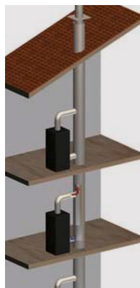
So funktioniert der neue Rauchgassammler MMW RS-R

Das neueste Moldrich Produkt, das System MMW RS-R, ist die bislang kreativste und nachhaltigste Entwicklung, die mehrere Probleme gleichzeitig löst. So stellt etwa der Nutzflächenverlust in Wohnhäusern für viele Architekten ein großes Problem dar. Erstaunlich viel Platz muss für breite und vor allem eine große Anzahl an Kaminrohren abgetreten werden. Wo doch Raumgewinn einer der wertvollsten Trümpfe ist, ist das neue, in sich geschlossene System der Firma Moldrich absoluter Pionier. Ernst Stögerer: „An ein einzelnes Rohr können bis zu sieben Geschosse angeschlossen werden! So erzielen wir eine enorme Platzreduzierung, an die Mitbewerber nicht annähernd herankommen.“