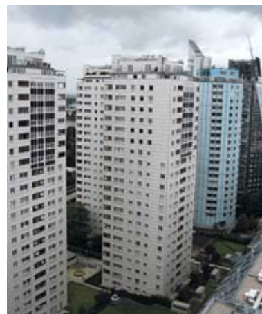
Am oberen Ende des Donaustädter Dichtespektrums: die Türme im Wohnpark Alte Donau, dessen Verbauungsgrad jedes gründerzeitliche Viertel in den Schatten stellt

Ein Paradebeispiel dafür ist der Wohnpark „Alte Donau“, errichtet in den späten 1990er Jahren zwischen der U1-Trasse und der vierspurigen Wagramer Straße. Die enorme Dichte des von sechs rund 60 Meter hohen Türmen bestimmten Quartiers folgte vordergründig dem Bestreben, eine städtebauliche Achse in Verlängerung der Reichsbrücke zu entwickeln. Tatsächlich aber kompensierte die überzogene Verbauung dieser Restfläche die drohenden Verluste jener Spekulanten, die das Areal in Erwartung der (später gescheiterten) EXPO '95 überteuert gekauft hatten. So ist der öffentliche Raum im Wohnpark viel zu knapp geraten. Gemeinschaftseinrichtungen – in vielen älteren Wohnbauten eine Selbst-