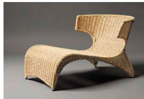
PS Sävo (2001), Design: Monika Mulder

den zentralen Faktoren bei der Realisierung der Idee, funktionale, gut gestaltete Möbel für möglichst viele Menschen leistbar zu machen. Dahinter stehen unter anderem Konzepte wie „Schönheit für alle“ (Ellen Key 1899), die ihre Wurzeln in den Reformbewegungen des 19. Jahrhunderts haben und sich im „schwedischen Modell“ einer modernen, offenen, familien- und sozialorientierten Gesellschaft bis heute manifestieren.