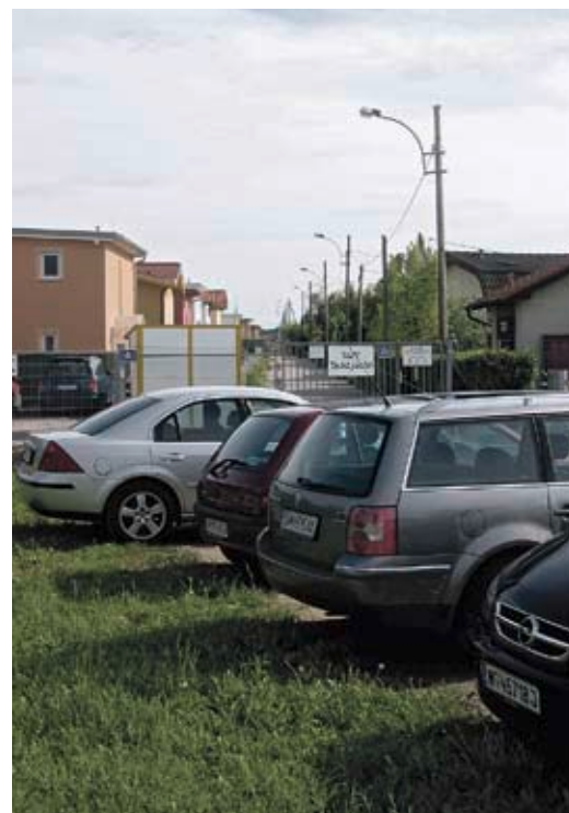
Andererseits finden sich hier städtebauliche Formen, die nicht nur immensen Bodenverbrauch nach sich ziehen, sondern hinsichtlich der Infrastruktur die planungs- und wohnbaupolitischen Mindeststandards Wiens unterschreiten (Kleingartenanlage Hausfeldstraße).