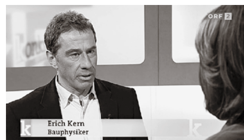
Kammerfunktionäre geben fachkundig Auskunft zu Problemen beim Bauen und Sanieren