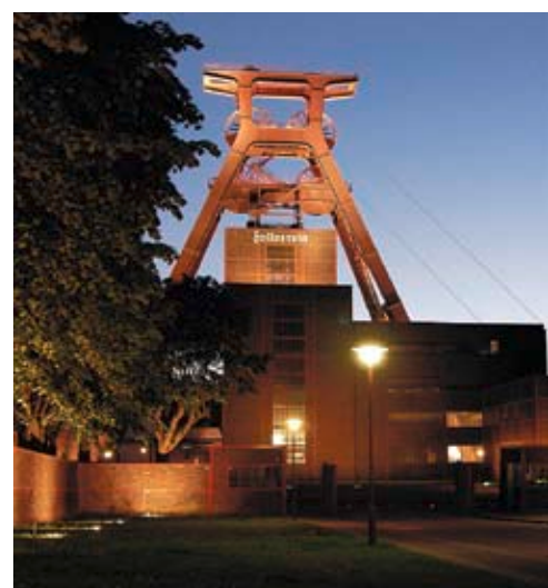
Zeche Zollverein in Essen