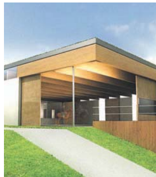
Entwurf Grimus (Wohofsky/Schneider/Prause)

Das gegen Westen hin auskragende Hallendach, das als schwebende Platte konzipiert ist, ermöglicht im Sommer einen beschatteten Bereich am Reitplatz. Im Inneren besteht die Deckenuntersicht aus lasierten OSB-Platten, die eine gute Streuung des Tageslichts erzielen. Ein weiterer Vorschlag von Strauß umfasst die Situierung des neuen Lagergebäudes im Norden des Hof-