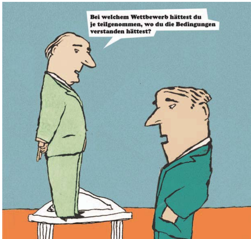
ILLUSTRATION: THOMAS RUSSEN

Der Lösungsvorschlag von Architekt Georg Driendl: Offene Wettbewerbe sollen auch von der öffentlichen Hand bezahlt werden. Und zwar über neue Förderungsgelder für Wettbewerbsforschung.