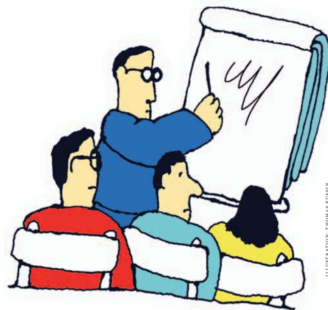
ILLUSTRATION: THOMAS KUSSIN

Die praktische Planung und Umsetzung von Brandschutzmaßnahmen erfolgt derzeit im Wesentlichen auf der Basis von speziellen Kenntnissen oder Erfahrungen sowie den technischen Richtlinien (TRVBs) bzw. Bauproduktennormen und den gesetzli-