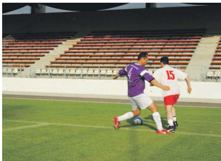
Ernsthafter Körpereinsatz in brennend heißer Sonne: Man hat einander nichts geschenkt.