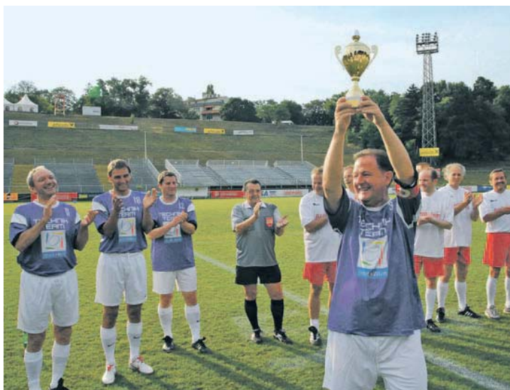
Das Technikteam Stadt Wien mit Pokal. Übrigens: Er wurde von der Stadt gestiftet. Noch Fragen?

Damit stand es 7:1. Oder so. Nachspielzeit gab es keine. Der souveräne Schiri übergab gleich nach Ende des Matches den von einer großen Hauptstadt, die anonym bleiben wollte, gespendeten guldernen Pokal. An welches Team, ist im allgemeinen Trubel untergegangen.