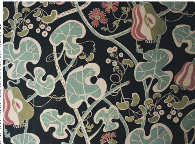
ARCHIV DER UNIVERSITÄT FÜR ANGENDE KUNST, HANS HAMARKELOD