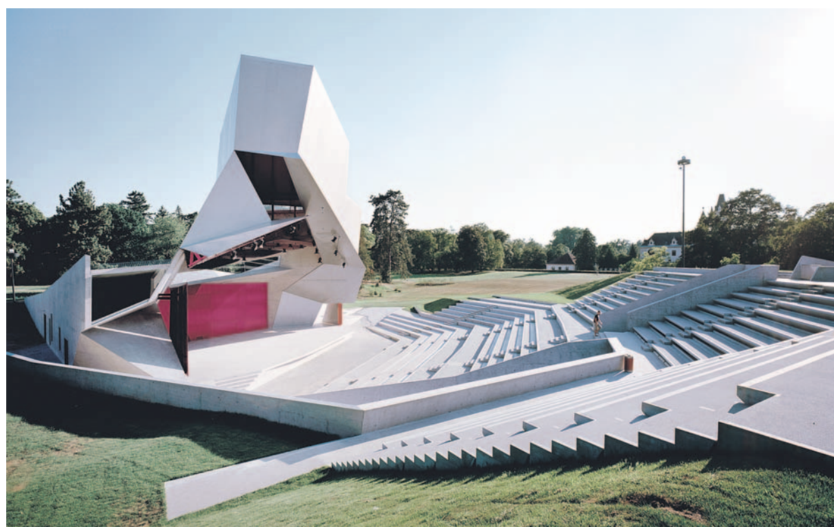
Das Siegerprojekt „Wolkenturm“ im Schlosspark von Grafenegg von „the next ENTERprise-architects“, Wien.